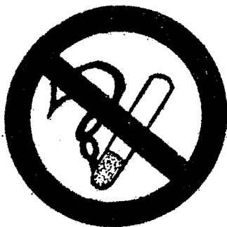
ἀπαγορεύεται τὸ κάπνισμα