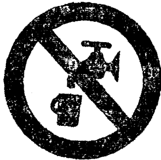
μή πρόσκιμον ύδωρ.

Τά ώς άνω σήματα άπαγορεύσεως έχουν βάθος λευκόν, σύμβολον μαύρον και έρυθρον χρώμα εις τό περίγραμμα και την έγκαρσίαν λωρίδα.