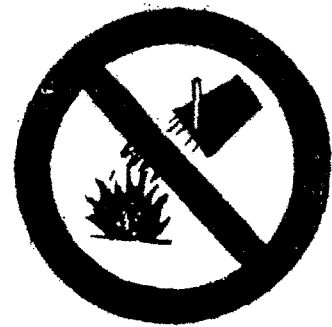
άπαγορεύεται ή σβέσις δι' ύδατος

Τά ώς άνω σήματα άπαγορεύσεως έχουν βάθος λευκόν, σύμβολον μαύρον και έρυθρον χρώμα εις τό περίγραμμα και την έγκαρσίαν λωρίδα.