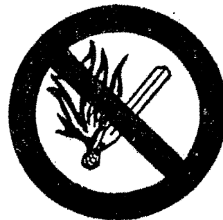
ἀπαγορεύεται ἡ γυμνὴ φλόγα καὶ τὸ κάπνισμα