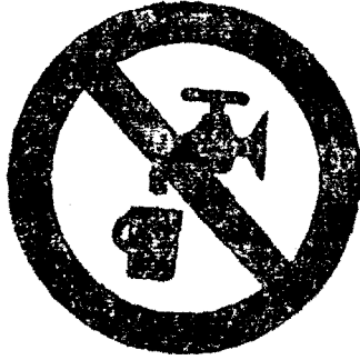
μή πρόσκιμον ύδωρ.

Τά ώς άνω σήματα άπαγορεύσεως έχουν βάθος λευκόν, σύμβολον μαύρον και έρυθρόν χρώμα εις τό περίγραμμα και την έγκαρσίαν λωρίδα.