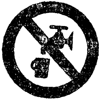
μή πρόσκιμον ύδωρ.

Τά ώς άνω σήματα άπαγορεύσεως έχουν βάθος λευκόν, σύμβολον μαύρον και έρυθρόν χρώμα εις τό περίγραμμα και τήν έγκαρσίαν λωρίδα.