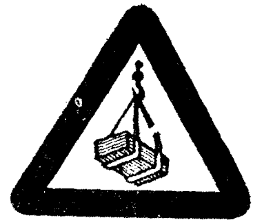
προσοχή 'Ανηρτημένα φορτία.